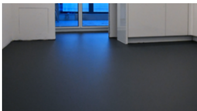
Fugenlose Bodenbeschichtung in allen Räumen