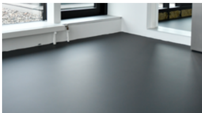
Direkte Lichteinstrahlung auf die matte Versiegelung