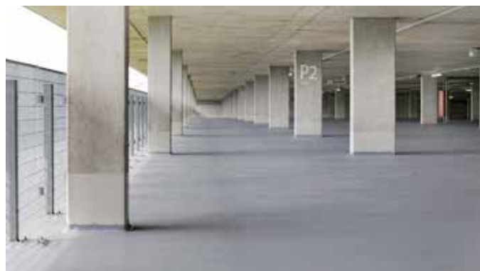
Parkfläche nach Instandsetzung