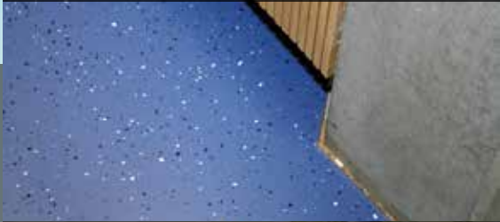
... für branchentypische Anforderungen