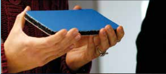
Ausgereiftes System ...