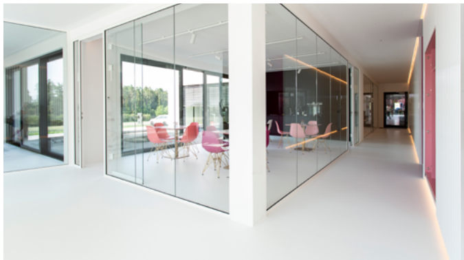
Perfekt verarbeitet und übergangslos in allen Bereichen