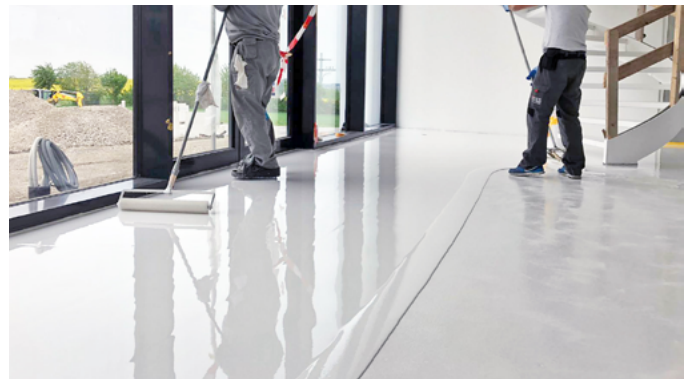
Perfekter Verlauf bei der Verarbeitung des Oberbelags