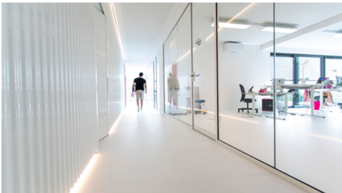
Eine helle und freundliche Arbeitsatmosphäre