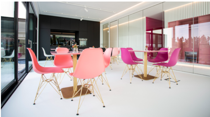
Die edle Kantine mit Küche und rundum Verglasung