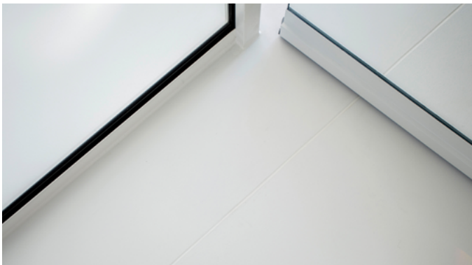
Die Verarbeitung von Dehnungsfugen und Abschlüssen