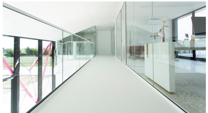
Die zweite Etage fügt sich nahtlos ein