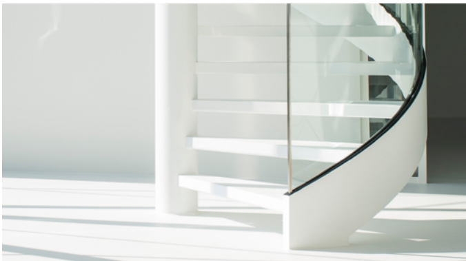
Die Treppe fügt sich nahtlos ein