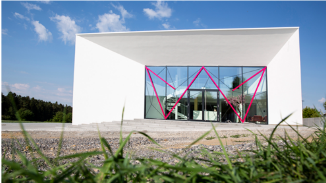
Das Firmengebäude mit integriertem Logo