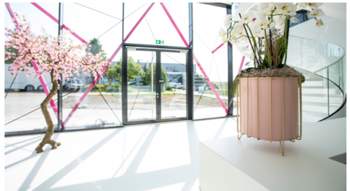
Streifenfrei im Gegenlicht