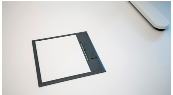
Deckel für Kabelzugänge im passenden Design